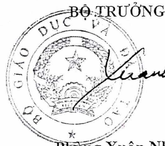
Phùng Xuân Nhạ